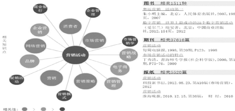
图1 营销活动相关知识点的拓展